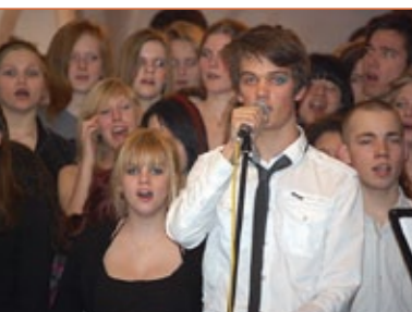
Den Rytmske Efterskole i Baaring

- den 14. og 15. april 2012 på Hotel Nyborg Strand